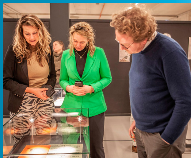
Bezoek raadsleden Renkum

Op maandag 16 januari brachten Arnhemse raadsleden en gemeentebestuurders een werkbezoek aan het Gelders Archief. Op maandag 13 februari volgden raadsleden en een wethouder van de gemeente Renkum en vervolgens het college van Gedeputeerde Staten van de provincie op dinsdag 19 december.