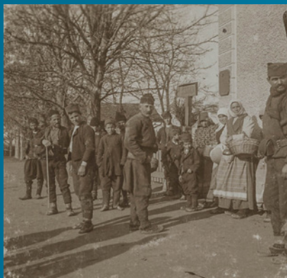
Foto van lokale bevolking in Bulgarije, 1912-1913