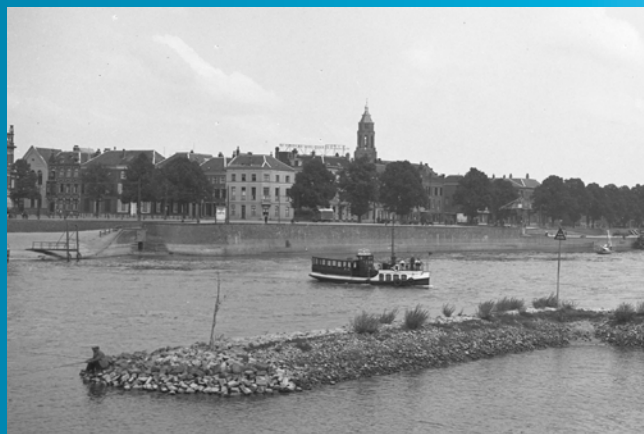
Skyline van Arnhem, 1935-1940.