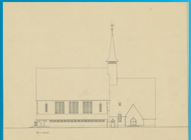
Ontwerptekening van de Paasbergkerk in Arnhem, 1931, ontworpen door Architectenbureau Heineman.