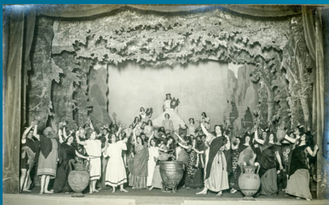
Atelier Studio Arnhem, Spelers uit het stuk 'Die Geschöpfe des Prometheus' van Beethoven, 1913

Twee medewerkers namen deel aan het samenstellen van de Arnhemse hotspotmonitor over 2020-2022. Een hotspot is een gebeurtenis waarbij er veel en intensief contact is tussen burgers en de overheid, of tussen burgers onderling. Een voorbeeld is de opvang van daklozen, asielzoekers en vluchtelingen op cruiseschepen. Er wordt van zo'n gebeurtenis extra archiefmateriaal bewaard. Het college van B&W Arnhem stelden de hotspotlijst in november 2023 vast.