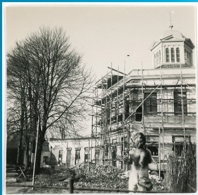
Gemeentemuseum van Arnhem in de steigers in 1950.

Foto's uit het archief van Jenny Cochijs (1912-1994), museumconservatrice van het Gemeentemuseum Arnhem van circa 1946 tot en met 1964, werden gedigitaliseerd. Het archief bevat persoonlijke foto's, maar ook foto's van haar werk bij het gemeentemuseum.